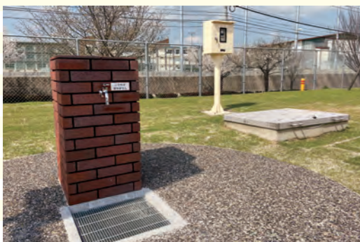
災害時に井戸水を利用できます。飲用はできません。