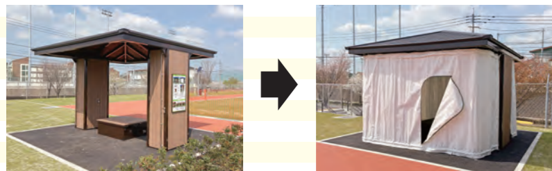
災害時に仮設テントシェルターとして利用できます。