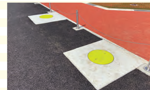
災害時に上水道が使用できないとき、飲用水として利用できます。