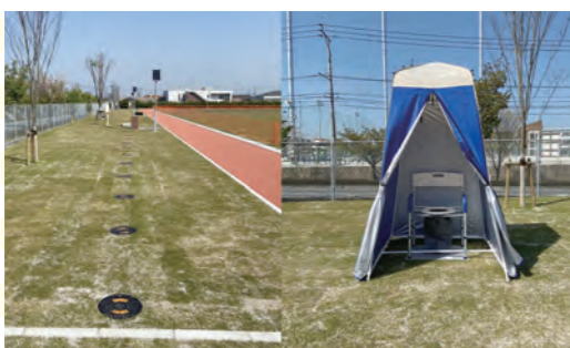
災害時にトイレとして利用できます。(10基)