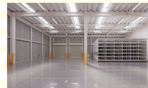
災害時に必要なものを保管し、物資拠点となります。