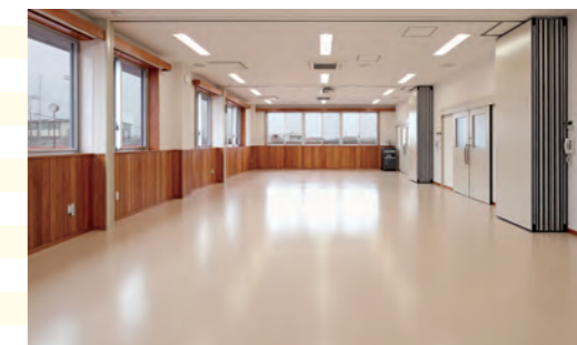
災害時は、要配慮者の屋内避難に、平常時には、防災に関する研修等で使用します。