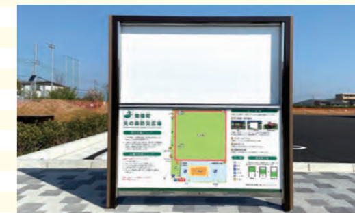
災害時に表示面をスライドさせて緊急掲示板として利用できます。