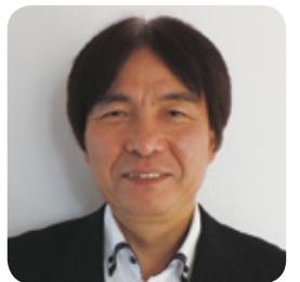
西本 友春 議員