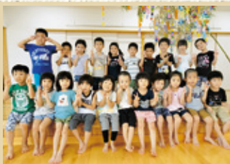
もみじ園の年長さんたち 七夕飾りの前で