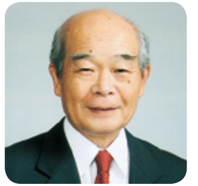
甲斐 榮治 議員

は緩衝地域の指定は考えていない。通学区変更の要望については、当該区の同意が得られ、地域住民の総意を踏まえるなどの正式な手続を経た場合は積極的に検討していきたい。