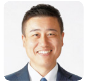
大久保 輝 議員