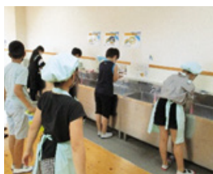
小学校における給食前の手洗い