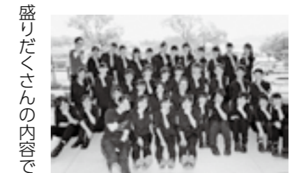
一緒に音楽を楽しみましょう