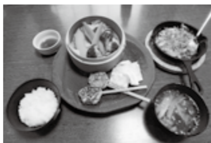
ヘルシー!おくらと山芋の 健康ネバネバ鉄板定食 750円(税込) 559kcal、塩分 3.2g、野菜 225g