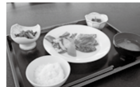
チキンとにんじんのチーズソテー御膳 700円(税込) 514kcal、塩分 2.9g、野菜 202g