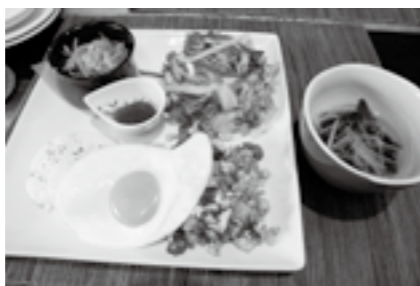
ガパオライス 1,280円(税込) 536kcal、塩分 2.9g、野菜 201g