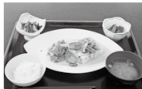
ヘルシー豆腐ステーキ御膳 700円(税込) 558kcal、塩分 2.5g、野菜 186g