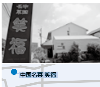
中国名菜 笑福 問い合わせ ☎(233)0425

すめ。他ではなかなか味わえない多国籍料理とタニタのコラボ。ぜひ味わってみてください。