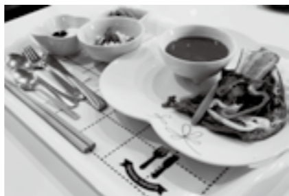
阿蘇赤牛ヘルシー 野菜スープカレー 1,000円(税込) 489kcal、塩分 2.2g、野菜 235g

健康拠点として、新たにスポーツジム・フィットネススタジオの機能を加えリニューアルオープンしたさんふれあからは「うまかだご汁御膳」「ぶりのんにく醤油焼き御膳」「チキンとにんじんのチーズソテー御膳」「ヘルシー豆腐ステーキ御膳」の4品の健康メニューがデビュー。さんふれあの特徴は直売所を持つ施設であること。地元の野菜をふんだんに使用し、タニタの監修によりヘルシーかつ満足感のあるメニューに仕上がっています。食事と併せて施設内のジムや温泉を利用することで、さらなる健康増進につながることで間違いなしです。