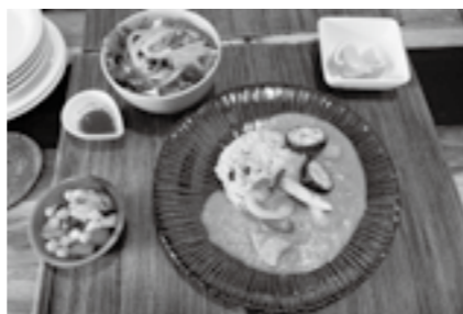
豆乳チキンカレー 1,280円(税込) 494kcal、塩分 2g、野菜 166g