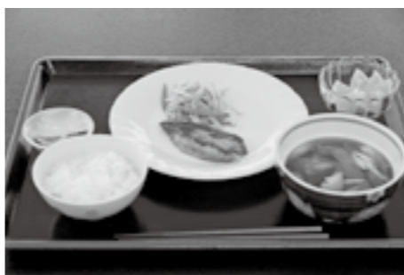
ぶりのんにく醤油焼き御膳 700円(税込) 574kcal、塩分 3.07g、野菜 153g