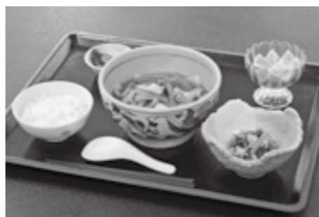
うまかだご汁御膳 600円(税込) 504kcal、塩分 2.9g、野菜 186g