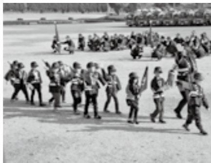
幼年消防クラブによる分列行進

会場では、消防団員による分列行進や通常点検、幼年消防クラブによる分列行進などを行います。町民の皆さんのお越しをお待ちしています。 日時 1月20日(日) 午前9時開会 場所 菊陽杉並木公園