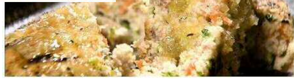
まくよう健康メニューはカブリアさん含めて現在4店舗