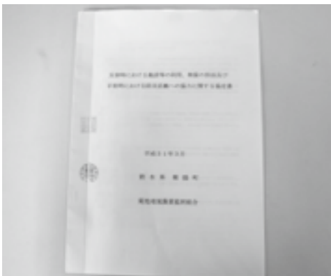
災害時の迅速な物資供給活動が可能になります

菊陽町と菊池地域農業協同組合とは3月、「災害時における施設等の利用、物資の供給及び平常時における防災活動への協力に関する協定」を締結しました。この協定は、災害時に速やかに円滑な支援物資の集積場を確保し、被災者に物資を供給、また、平常時においても相互が情報交換などを行い、緊急時に備えることを目的として締結されたものです。