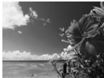
一足先に夏を迎える沖縄の風景を 楽しみましょう

今回のイベントで、期間内に設定された区間をクリアした会員に300ポイント進呈します。(自動的に付与)