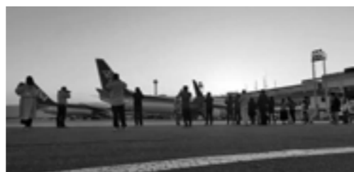
昨年度のイベントの様子