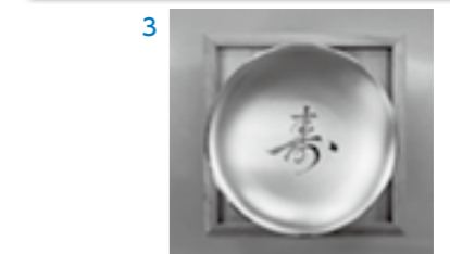
2. 3. 内閣総理大臣からのお祝い状と記念品