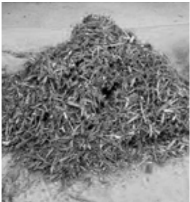
チップ状に粉砕された樹木