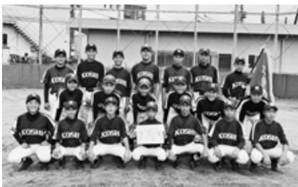
優勝した合志中学校