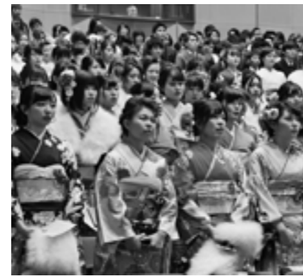
昨年の成人式の様子

その他 式典の後、記念撮影やアトラクションを実施しますので、ぜひ、ご参加ください。