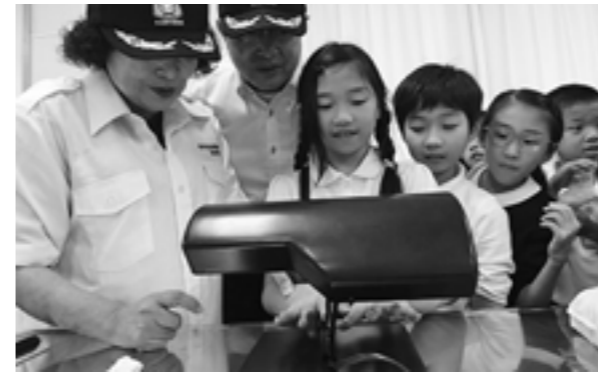
手洗いチェッカーで洗い残しを確認！

初めに手洗い方法の説明を受けた後、特殊なハンドクリームを手に塗り、手洗い後にハンドクリームの成分が反応するライトに手を当て、洗い残しがないかをチェックしました。ハンドクリームの成分が残っていたときは、「この部分に気を付けて洗おうね」と協会員と確認していました。