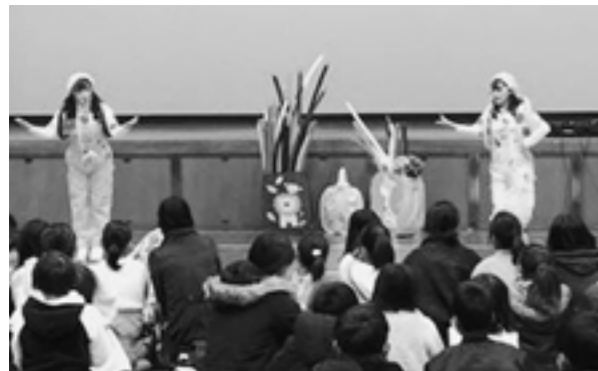
多くの子どもたちが集まりました

令和元年度菊陽町子ども会大会が12月8日に町民体育館で開催され、100人が参加しました。今回は九州を拠点に活動を行っているバルーンユニット「チャオチャオ」の二人を招き、バルーンアートショーを行いました。歌を歌いながら、バルーンを使って犬やツリーなどさまざまなものを作成し、出来上がった作品は子どもたちにプレゼントされました。最後はバルーンで刀作りを行い、子どもたちはもちろん保護者も一緒に楽しみました。