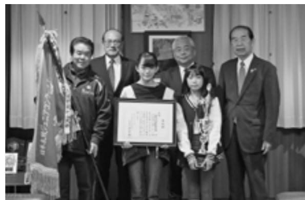
優勝した菊陽武蔵剣豪太鼓の皆さんと副町長、教育長、町長