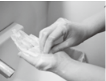
③指先・爪の間を念入りにこすります