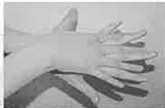
2. 手の甲を伸ばすように洗う