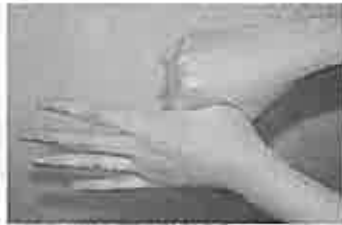
5. 親指と手掌をねじり洗いする