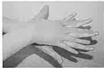
2. 手の甲を伸ばすように洗う