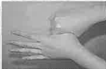
5. 親指と手掌をねじり洗いする