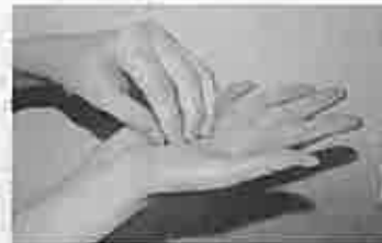
3. 指先、爪の間をよく洗う