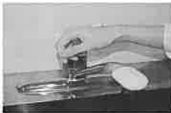
7. 水道の栓を止めるときは、手首が肘で止める。できないときは、ペーパータオルを使用して止める