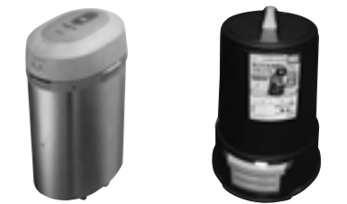
電動式生ごみ処理機 生ごみ処理容器

町は電動式生ごみ処理機や生ごみ処理容器を購入した人に補助をしています。食品ロス削減のためにも生ごみ処理機を設置してみませんか。