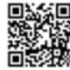
まち遊び ホームページ

■要件 町内の店舗などで、飲食物のテイクアウトなどを行う事業者の申請書の提出後に、商工会による審査があります。詳しくは、「菊陽まち遊び」のホームページをご覧ください。お問い合わせください。