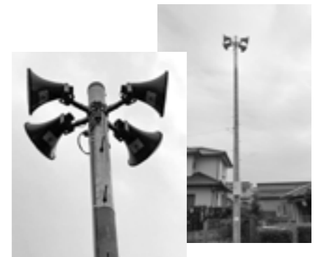
宝くじ助成で三里木区公民館と三里木駅前広場に整備された放送設備

コミュニティの健全な発展を図ることを目的としたコミュニティ助成事業で、三里木区に屋外放送設備(ワイヤレス方式)が整備されました。同事業は、一般財団法人自治総合センターが宝くじ社会貢献広報事業費を財源として助成決定を行うもので、今後の三里木区のますますの活性化が期待されます。