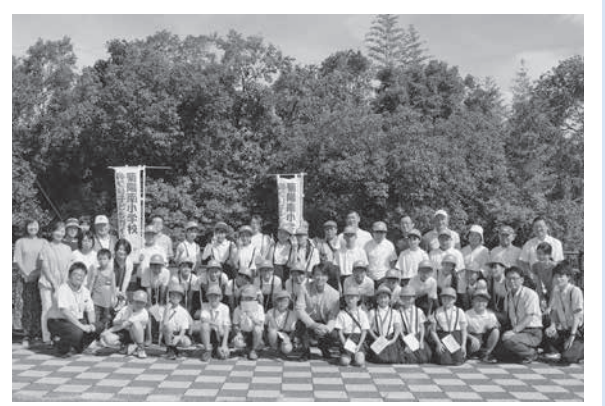
子どもたちは鼻ぐり井手のガイドも務めています

菊陽南小学校(児童数86人)は、「夢と笑顔、けんめいに歩み続ける南っ子の育成」を目標に、「子ども中心」「日々の授業」を大切にしています。「子ども中心」については、①あいさつと言葉使い、②分かるまで学ぶ姿勢、③体力・忍耐力の育成に向けて、「日々の授業」については、①授業改善、②個別指導の徹底、③家庭学習の工夫について共通実践を進めています。家庭・地域と連携し、小規模校の良さを生かして、子どもたちの夢や笑顔が広がる学校を目指します。