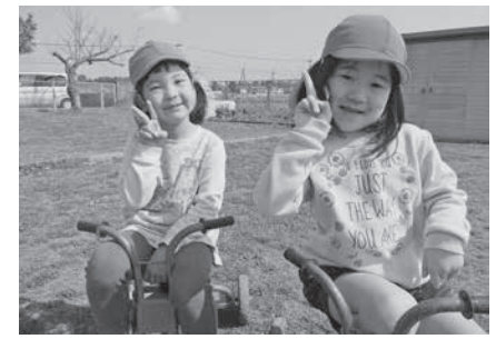
友だちと三輪車でお出かけ(作者右)