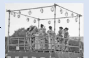
昨年の町民盆踊り

8月1日(土)に開催を予定していた「第45回菊陽町夏まつり」は、夏祭り実行委員会検討した結果、新型コロナウイルス感染拡大防止のため、中止することに決定しました。夏祭りを楽しみにしていた皆さんにおきましては、安全を最優先に考えての決定にどうかご理解いただき、来年以降の夏まつりにご支援、ご協力をお願いします。