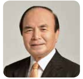
廣瀬 英二 議員