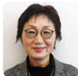
那須 真理子 議員

指導員の確保については、深刻な人材不足のため苦戦している。すべてのクラブの公平性を保つために、指導員の配置転換を行うなど対応している。