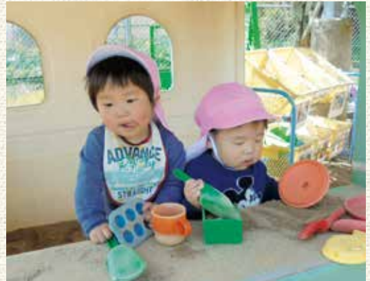
おいしいごはんできるかな

現在、コロナウイルスの感染が拡大している状況において、保育園でも、職員の毎日2回の検温に加えて、園児についても