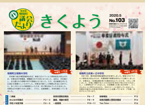
町内二校の中学校の卒業式の様子