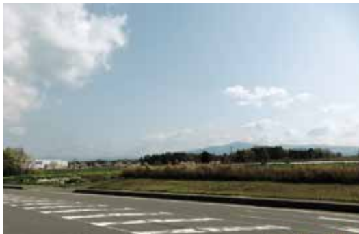
（仮称）第二原水工業団地建設予定地

特産品製造、販売促進補助金は、特産品を製造している事業所が5団体あり、25万円を上限として125万円の補助をしている。