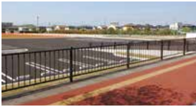
光の森防災広場の隣の土地を整地

土地整備の予算は、武蔵ヶ丘中学校グラウンド拡張のための一時的なテニスコートであり、拡張も終わった現時点ではテニスコートとして使われておらず、雑草も多くなっているため、整地し更地にする。