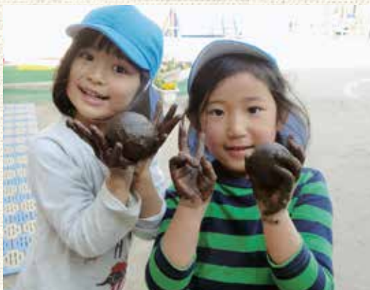
ぴかぴか光る泥団子をつくるよ

今後も、子どもたちや大切な人を守るために、地域の保育所として、また子育て支援の拠点として、保育所の子どもだけでなく、地域の子どもたちへの支援ができるような体制づくりを進めていきます。