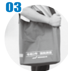
青色の手提げバッグを持っています。