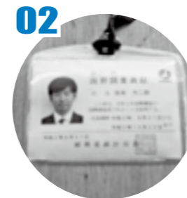
「国勢調査員証」を身に付け、青色のストラップをしています。