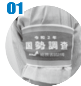
青色の腕章を着用しています。