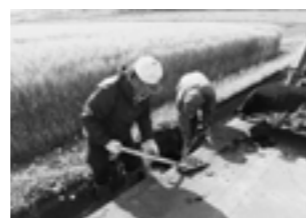
農道側溝の泥上げ

■問い合わせ 菊陽町農村環境保全隊事務協議会 ☎(293)7522 菊陽町農政課 ☎(232)4916