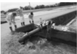
大雨後の水路の点検