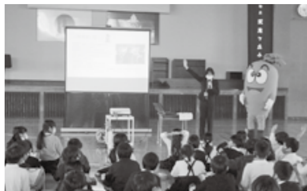
熱心に講話を聞く児童

出前講座(菊陽町の農業とにんじんについて)が、1月14日、武蔵ヶ丘小学校で行われました。講師は地域学校協働活動推進員。3年生49人はクイズに挑戦しながら、熱心に講話を聞きました。講話の途中で町のマスコットキャラクター「キャロッピー」も登場し、児童は楽しい時間を過ごしました。児童の一人は、「にんじんの根元と先端で味が違うのを初めて知りました。これからもにんじんをたくさん食べたいです」と感想を話しました。