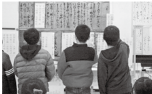
積極的に授業に参加する児童

授業後、児童の一人は「昔の人が気持ちを込めて作ったものを壊したり、いらないと思ったりせずに大事に残していきたい」と話しました。