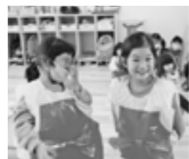
満面の笑みの園児