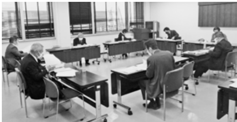
慎重な審議が進められました

また、策定委員会は8人の委員で構成され、これまで4回にわたり会議を開催し、専門的な立場から慎重なご審議をいただきました。 今後は、策定委員会からの提言を踏まえ、町の都市計画審議会の審議を経て、計画の決定を行うこととしています。