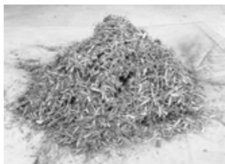
チップ状に粉砕された樹木

※搬入の際はマスクを着用し感染症対策を十分に行ってください。当日発熱やせきの症状がある人は来場をご遠慮ください。