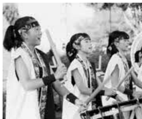
令和元年度菊陽町夏まつりのステージ発表

夏祭りを楽しみにしていた皆さんにおかれましては、安全を最優先に考えての決定にどうかご理解いただき、来年以降の夏まつりにご支援、ご協力をお願いします。