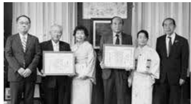
熊日および町表彰を受けた2組のご夫婦(昨年度)