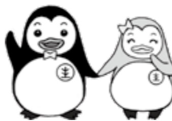
更生ペンギンの ホゴちゃん サラちゃん