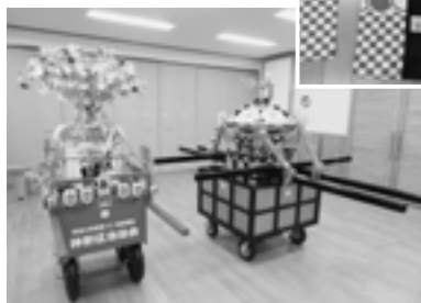
宝くじ助成で沖野区に整備された子どもみこしと法被