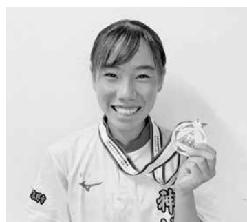
試合で真剣な表情(左) 優勝メダルを掲げて満面の笑顔を見せる(右)