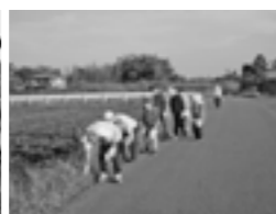
農道の空き缶・ごみ拾い