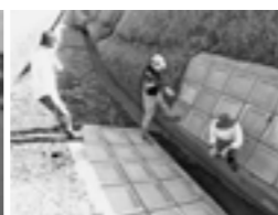
大雨や台風後の見回り点検