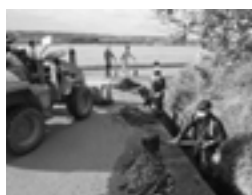
側溝の泥・ごみ上げ

古閑原、入道水、柳水、馬場、鉄砲小路、新町、南方、中尾、上中代、出分、中代、川久保、津留、大堀木、上津久礼、下津久礼、井口、辛川、曲手、馬場楠、戸次、原水