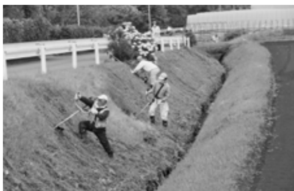
水路法面や農道の草刈り

菊陽町農地水広域協定では、町の農業環境を守るため農道の草刈り、水路の補修や清掃、関連施設の保守管理などの活動に取り組んでいます。