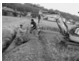
大雨によって崩れた農地法面の補修