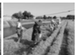
景観形成のための遊休農地や農道沿いの花植え

■ 問い合わせ 町農村環境保全隊事務協議会 ☎(293)7522 農政課 ☎(232)4916