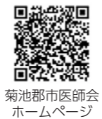
菊池郡市医師会ホームページ

※受診するときは各医療機関へ電話でご確認ください。最新情報は菊池郡市医師会テレホンサービス☎0968 (25) 3300もしくは菊池郡市医師会ホームページでご確認ください(歯科・薬局を除く)。