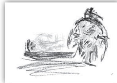
生活画 「パパとおふろにはいったよ」

パパとおふろにはいったよ。 ぼくは、じぶんでかみをあらうよ。 しあげでせなかとおしりは パパがあらってくれる。 おふろからあがって、あそぶことをやくそくしてた