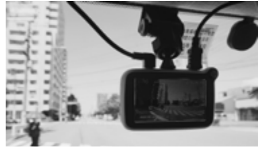
ドライブレコーダーの設置で、もしものときに備える