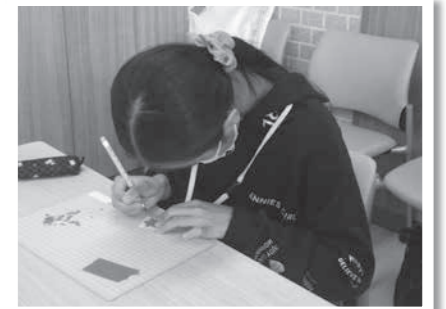
集中してペンダントのデザインをする参加者

町内の小中学生10人が参加しました。講師は(株)愛歯の職員3人。スライドで作り方や、材料のリサイクル金属について学び、自分の好きなデザインで、ペンダントの型を作りました。1週間後に型をもとに作られたペンダントと対面した参加者は、「自分の好きなデザインで自由に作れてとても楽しかったです」と感想を話しました。