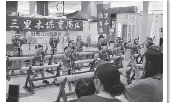
アトラクションとして竹太鼓を披露する園児

共同募金運営委員会、地域女性の会、更生保護女性会、三里木保育園の園児が参加。この活動は、全国一斉に10月～令和5年3月に住み慣れた地域の中で安心して暮らせる地域社会を作るために行う募金活動です。募金は、町内の地域福祉活動に活用されます。今年度の目標額は募金総額530万円です。