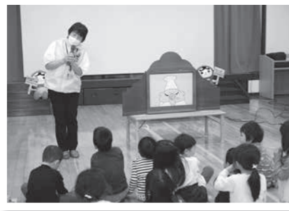
紙しばい「ごきげんのわるいコックさん」 でコックさんの気持ちを考える

子どもたちが相手を思いやり、みんなが楽しい保育園生活を送ってほしいと5人の人権擁護委員による人権学習が行われました。32人の園児が参加し、手遊びやビデオ鑑賞、紙芝居の登場人物の気持ちを考えました。園児たちは「いやな気持ちになったときはどうする？」という質問に「パパとママにおはなしする」など積極的に手を挙げて発表していました。