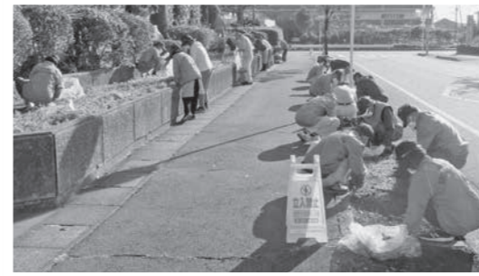
清掃活動に真剣に取り組む会員

役場周辺で清掃活動が行われ、会員と職員合わせて約100人が参加しました。この活動は、地域社会への貢献とセンターを地域住民に広く知ってほしいと、年2回実施しています。今回は役場前植栽帯の除草やその周辺のごみ拾いを行いました。参加した会員は、「夏のような暑さでしたが、気持ちよく清掃活動ができました」と笑顔を見せました。