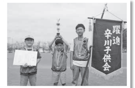
優勝「辛川グリーン」チーム