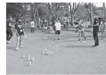
白熱した試合の様子