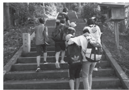
助け合いながら石段を登るジュニアリーダー達

町ジュニアリーダーの野外体験活動が、美里町で行われました。参加者は8人。午前中は、元気の森かじかで、ヤマメのつかみ取りや調理、火起こし、羽釜炊飯体験などを行い、午後は、日本一の石段3,333段に挑戦しました。ジュニアリーダーの一人は「ヤマメをさばくとき、改めて命の重さを感じました。石段は、みんなで支え合って登りきれたのがうれしかったし、達成感もありました」と感想を述べました。