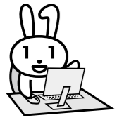
マイナンバーのPRキャラクター「マイナちゃん」

◆電子申請に必要なもの ・マイナンバーカード ・電子証明書の暗証番号 ・スマートフォンまたはパソコン・ICカードリーダー ※スマートフォンやICカードリーダーは、マイナンバーカードの読み取りに対応した機種をご用意いただく必要があります。