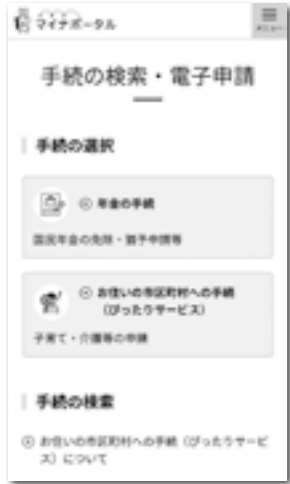
QRコードにアクセスした画面

◆電子申請に必要なもの ・マイナンバーカード ・電子証明書の暗証番号 ・スマートフォンまたはパソコン・ICカードリーダー ※スマートフォンやICカードリーダーは、マイナンバーカードの読み取りに対応した機種をご用意いただく必要があります。