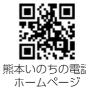
熊本のいのちの電話 ホームページ

申込期限 4月28日(金) ④ 熊本のいのちの電話事務局 平日午前10時～午後5時 232-4343