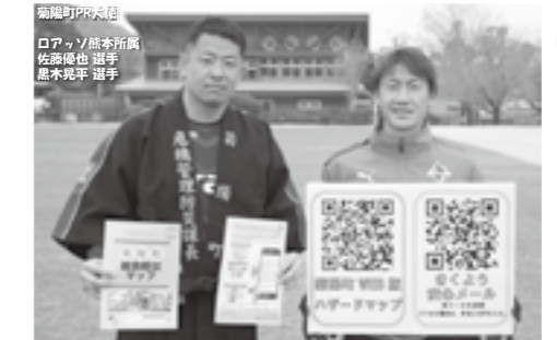
COCOAR(ココアル)というアプリを使用したAR機能を組み込んであります。右記QRコードから「COCOAR(ココアル)」アプリをダウンロードしてください。写真を読み込むと、動画が流れます。