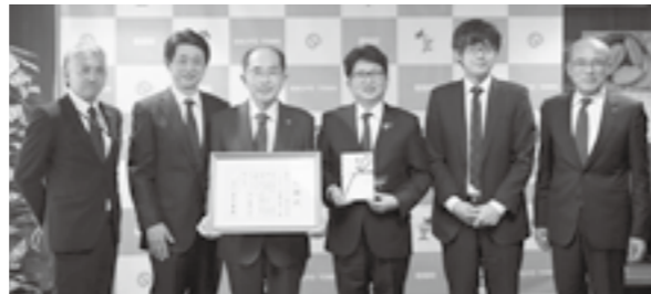
富士フィルム九州株式会社の皆さんと記念撮影の様子 (写真左から3人目が中泉代表取締役社長)

企業版ふるさと納税は、自治体が行う地方創生の取組に賛同した企業が、社会貢献として収益の一部を寄附し、まちづくりを応援する制度です(本社の所在地がある自治体への寄附は対象外)。