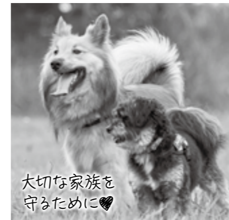
大切な家族を守るために♡

狂犬病は恐ろしい病気 狂犬病は全ての哺乳類に感染する恐れがあり、人が感染するとほぼ100%致死に至る大変恐ろしい病気です。日本での感染は昭和31年を最後に確認されていませんが、世界では毎年約5万人が亡くなっています。 狂犬病が発生したときに迅速に対応するために、日頃から犬がごで飼われているかなどを把握しておく必要があります。そのため、犬の飼い主には登録と狂犬病予防注射の接種が法律で義務付けられています。