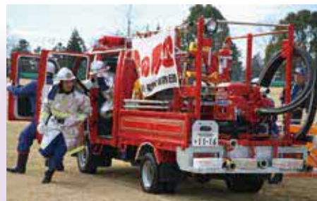
出初式で訓練の成果を披露する消防団員