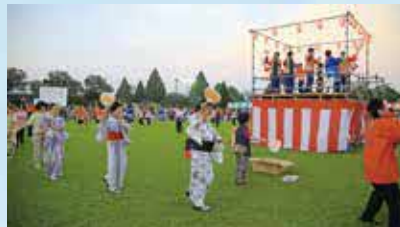
菊陽町夏まつりの町民総踊り