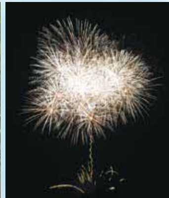
菊陽町夏まつりを盛り上げる大輪の花火