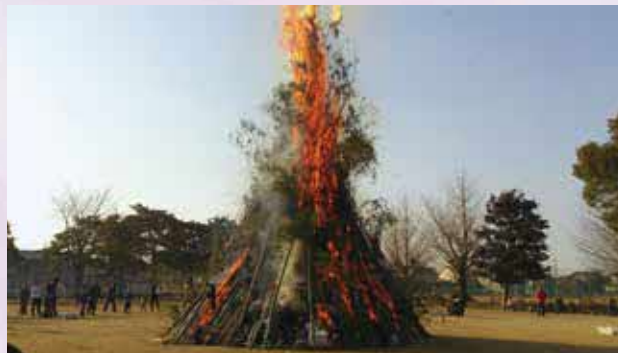
天高く燃え上がるどんどやの炎