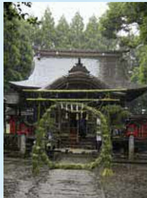
無病息災を祈る大原阿蘇神社の茅の輪くぐり