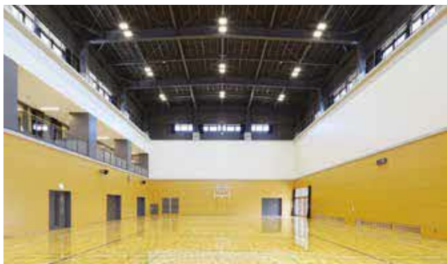
サブアリーナ 面積(約627㎡)