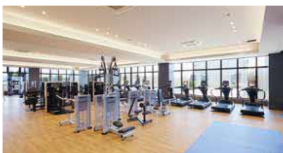
トレーニング室 面積(約299㎡)