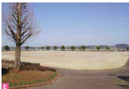
C 公園管理センター ホールには姉妹都市でもある、屋久島町より、姉妹都市盟約の絆として寄贈された大きな「屋久杉根株」が展示されています。他にも学習室などがあり、公園と共に、広く利用されています。