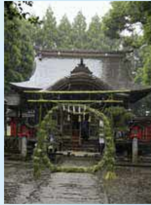
無病息災を祈る大原阿蘇神社の茅の輪くぐり