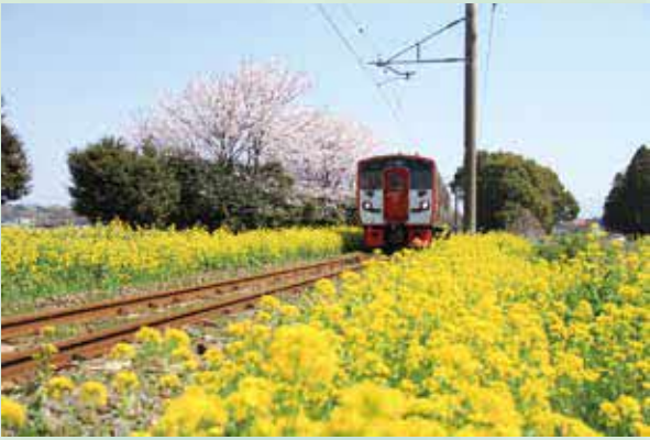
豊肥本線沿いの桜と菜の花