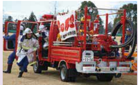
出初式で訓練の成果を披露する消防団員