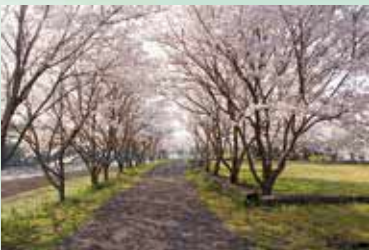
出分公園の満開の桜