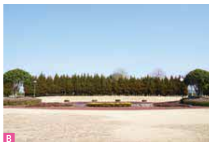
B 野外ステージ イベント時のステージなどとして利用できる野外ステージです。バックスクリーンには町の木である、杉の木が列植してあります。