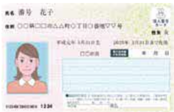
マイナンバーカード見本

コンビニ交付サービスは、マイナンバーカード(写真・電子証明書付)を利用して、コンビニエンスストアなどにある多機能端末機(マルチコピー機)で各種証明書を取得できるサービスです。