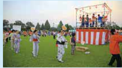
菊陽町夏まつりの町民総踊り