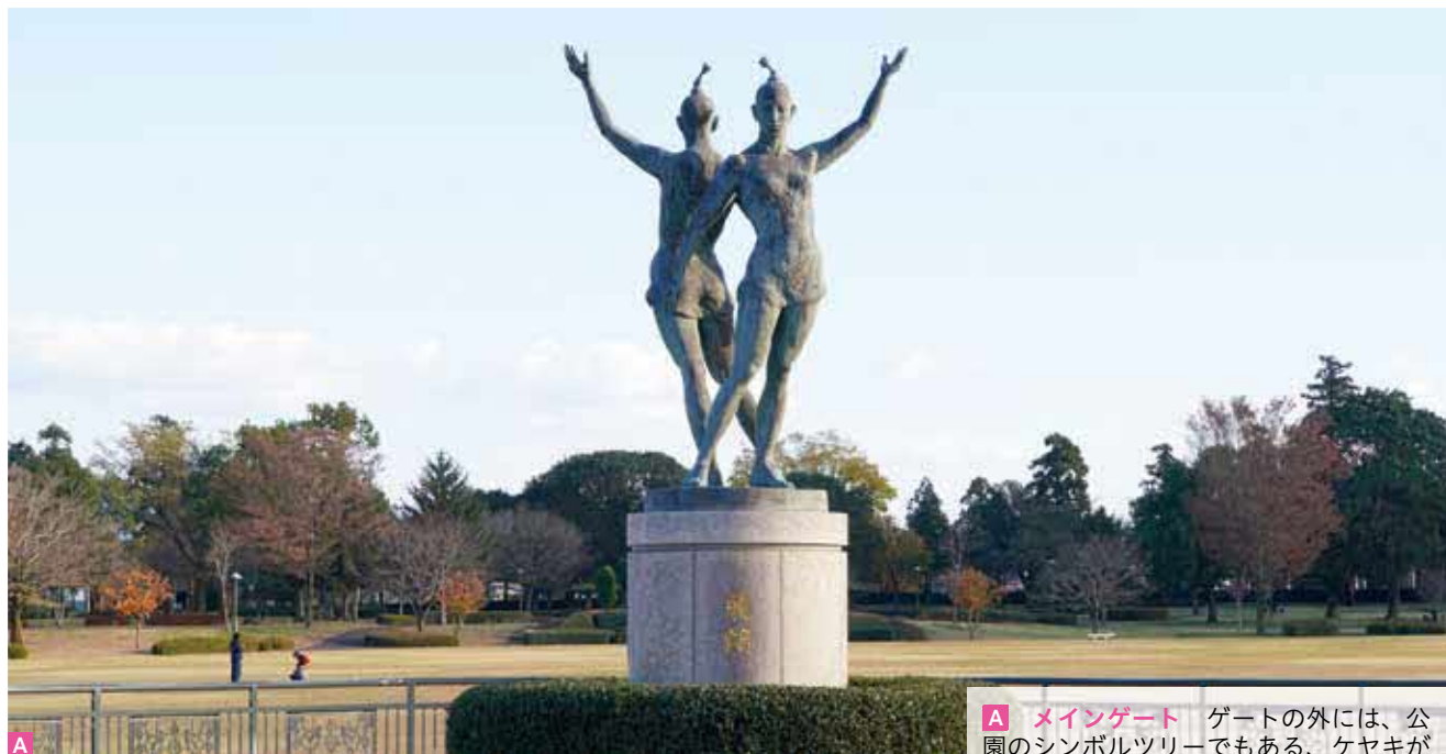
A メインゲート ゲートの外には、公園のシンボルツリーでもある、ケヤキがあり、ゲートをくぐると、目の前に広がるふれあい広場までの通路はケヤキ並木になっています。