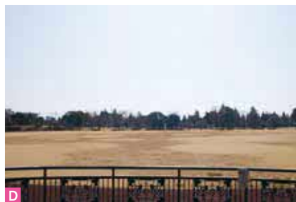
F 中央広場 メインゲートからまっすぐ奥に位置する中央広場。階段を上ると、手前にキャンドル噴水、奥に樹氷噴水が配置されています。噴水の周りには花壇が広がり、休憩の場として利用ができるように、パーゴラやベンチなどを配置しています。