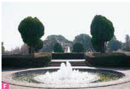
E スポーツ広場 スポーツをするのに、最適な広々とした広場です。外周には、16種類の桜を植栽しており、春になると、お花見を楽しむ人々の憩いの場としても活用されています。