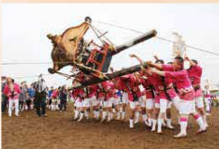
みこしを畑へ力いっぱい落とす。お法使祭