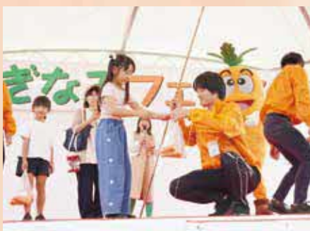
すぎなみフェスタで町の甘いにんじんを釣る