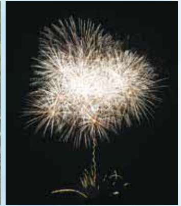
菊陽町夏まつりを盛り上げる大輪の花火