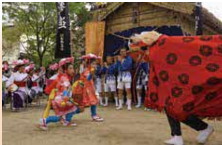
獅子楽に合わせて舞う馬場桶の獅子舞