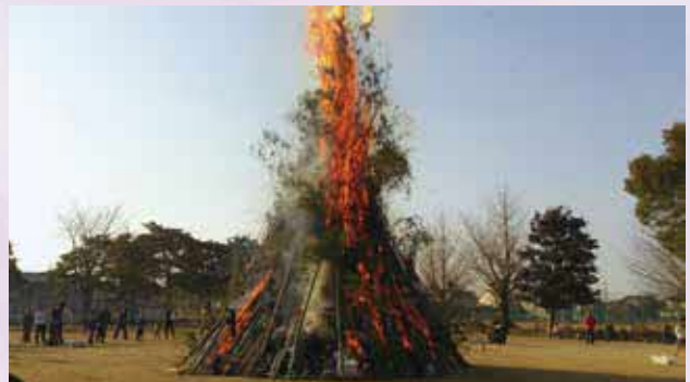
天高く燃え上がるどんどやの炎