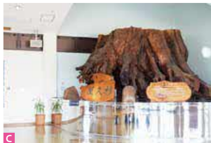
D ふれあい広場 緑あふれる広々としたふれあい広場は各種イベントはもちろん、家族連れや、カップルの憩いの場として利用されています。