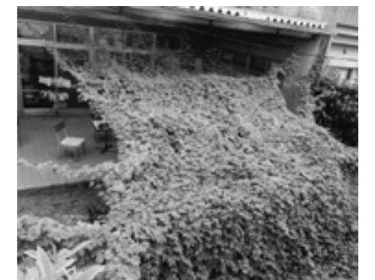
昨年最優秀賞者作品