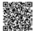
週日開廳HP （經辦業務等）