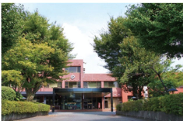
役场本馆的正面玄关