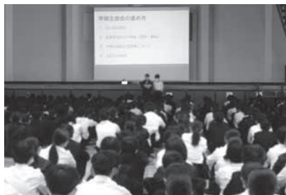
全校集会で学級生徒会の説明をする様子