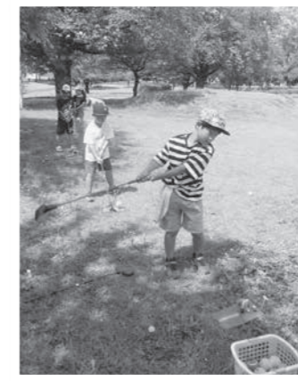
ターゲットを狙ってスイングする児童

小学生の1人は「最初はボールが真っすぐ飛ばなかったけれど、真っすぐ飛んだ時は気持ちよかったです」と話しました。将来の夢の一つに「プロゴルファー」が追加されるかもしれません。