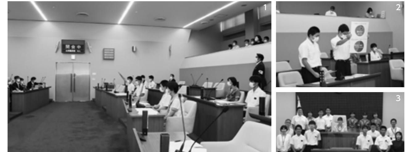
1. 昨年度開催した子ども議会で堂々と質疑する子ども議員 2. 自作の資料で説明しながら執行部に問う 3. 昨年度参加した生徒と先生

次世代を担う子どもたちが、町政や議会の仕組みなど、政治に対する意識を高めることを目的に子ども議会を開催します。子ども議会では、菊陽中学校と武蔵ヶ丘中学校の代表生徒が日常生活から感じた町政への疑問や、町の将来を執行部に質問・提案します。