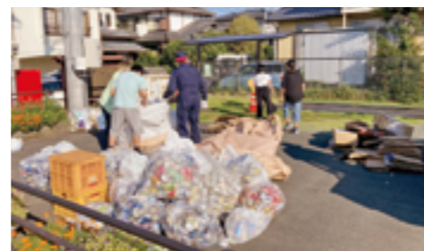
青葉台区による集団回収の様子