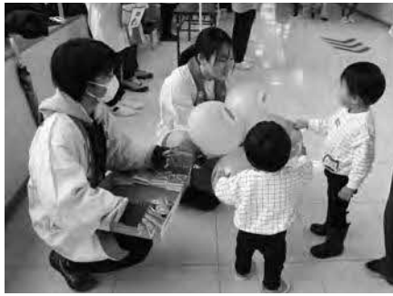
ジュニアリーダー募金活動の様子