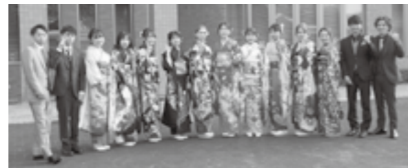
前年度実行委員の皆さん