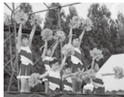
ステージでチアダンスを披露する出演者(昨年度)