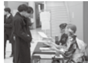
当日は受付も行いました