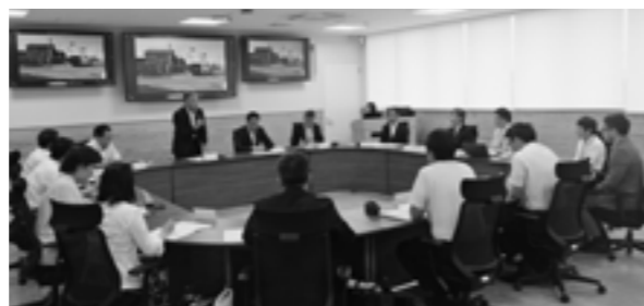
会議で開会のあいさつをする二殿教育長

6月26日には、通学路合同点検で確認した危険箇所の対策内容や進捗状況に関係者間で共有し、今後の安全対策を強化するため、第1回「菊陽町通学路安全対策会議」を開催しました。