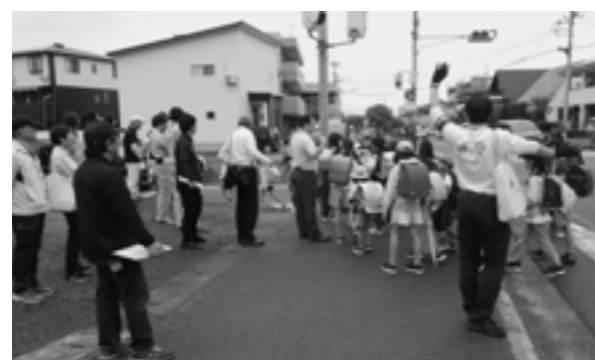
菊陽中部小学校の通学路点検で児童の通学状況を確認した